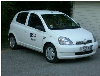
Bílinn sem við höfðum