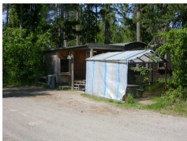
Slökkvistöðin á æfingasvæðinu