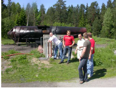
A – vaktin