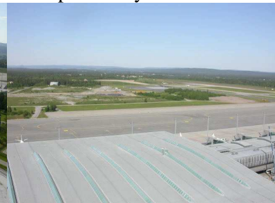
Séð úr turni