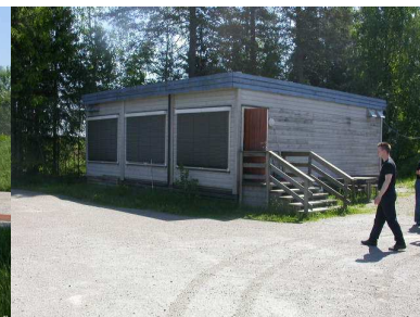
Kennslustofa á æfingasvæðinu