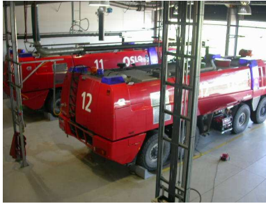
Slökkvistöðin á Gardermoen flugvölli