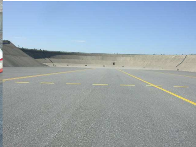
Svæði til að prófa hreyfla