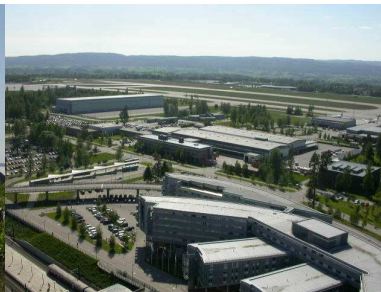
Séð úr turni