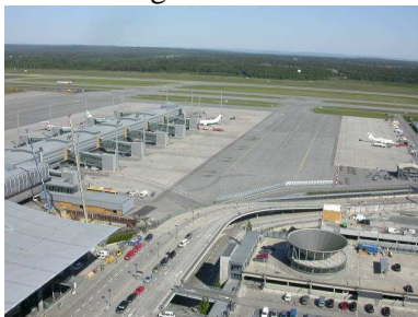
Séð úr turni