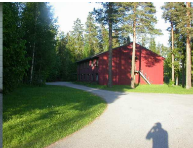
Skólinn og gisting