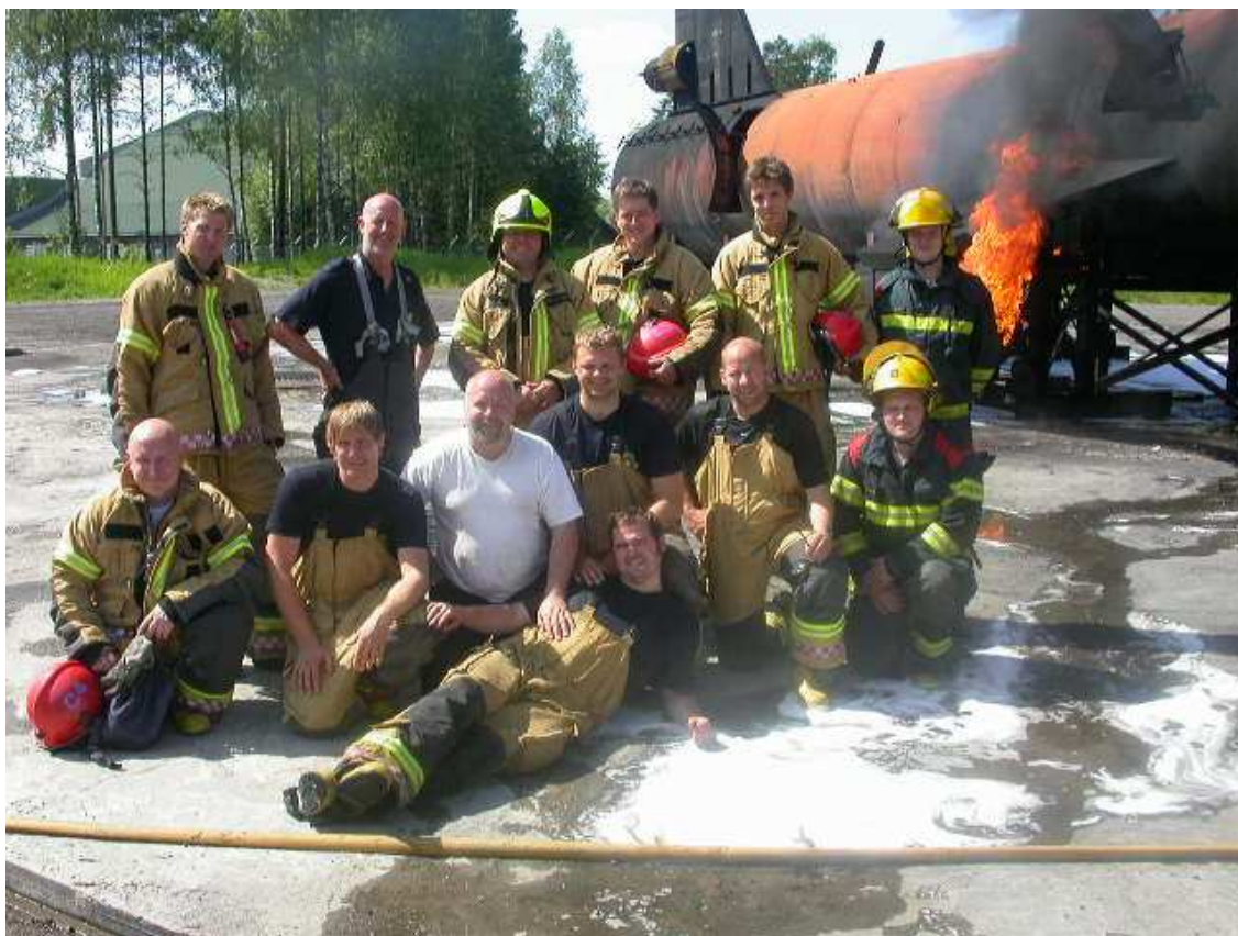
Hópurinn: A og C vakt frá Sandefjord Torb og við Íslendingarnir