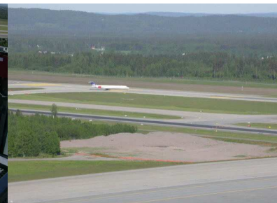
Séð úr turni