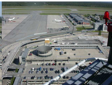
Séð úr turni